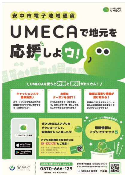
▲加盟店掲示ポスター