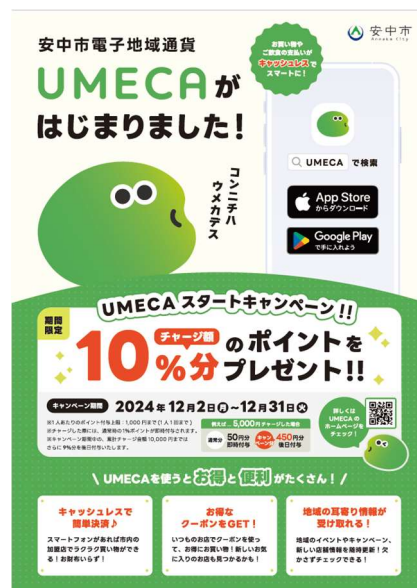
▲利用者向けチラシ